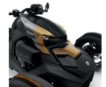
Fiebre del oro