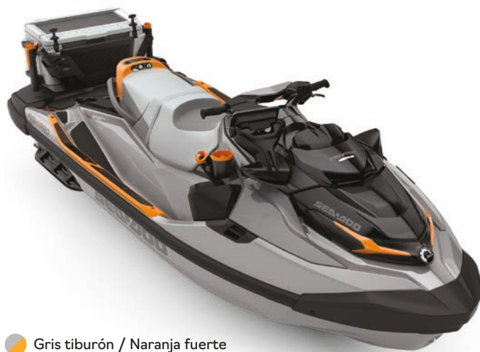
● Gris tiburón / Naranja fuerte