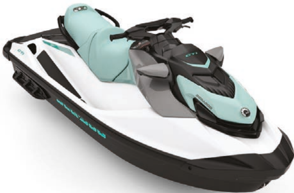
Bright White / Neo Mint

Estilo, estabilidad y diversión en serio.