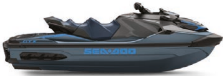
Blue Abyss and Gulfstream Blue