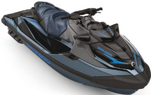
Blue Abyss / Gulfstream Blue

Confort, control y potencia, siempre con estilo.