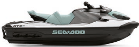
White and Neo Mint