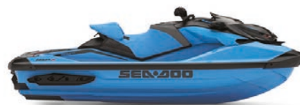
● NEW Gulfstream Blue Premium