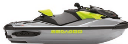
● Ice Metal and Manta Green