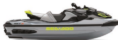
● Ice Metal and Manta Green