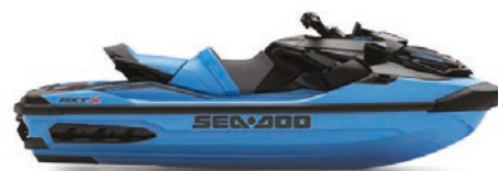
● NEW Gulfstream Blue Premium