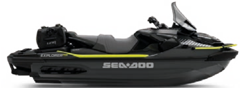
● Iceland Grey